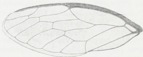
Fig. 2. Heptaglena libanotica n. sp. Elytrum.

abdominis sat longe superantibus, ante medium testaceo-, pone medium nigro-venosis, trunco basali communi venarum ulnarium venula transversa areolam basalem apice terminante duplo longiore, ramo ulnari postcostali pone medium areæ apicalis primæ extenso, area apicali septima extus quam intus paullo plus quam duplo longiore, limbo axillari clavi rubro; segmentis dorsalibus abdominis (segmento basali excepto) postice anguste rubro-limbatis; lateribus pectoris testaceo-maculatis; ventre rufo-testaceo, segmento primo maculaque basali media sensim decrescente segmentorum sequentium nigris, segmento ultimo