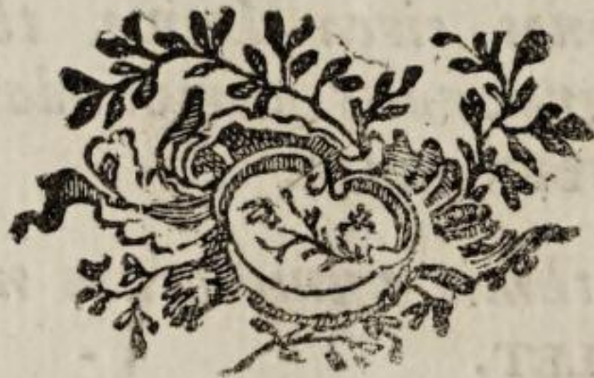
Fig. 4. ad pag. 303. lin. 25.